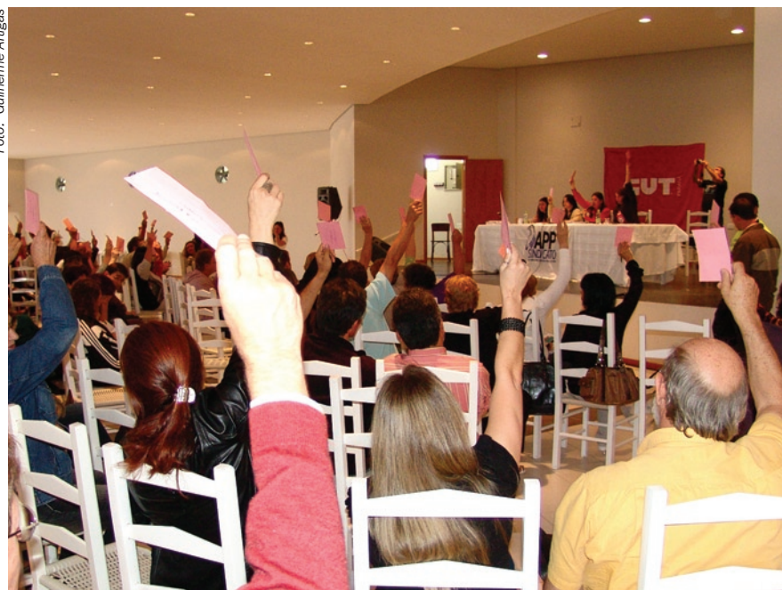
Assembleia estadual em 13/12/2008

Fique atento! A APP disponibilizará informações sobre o assunto no Portal www.app.com.br , assim que o decreto for publicado.