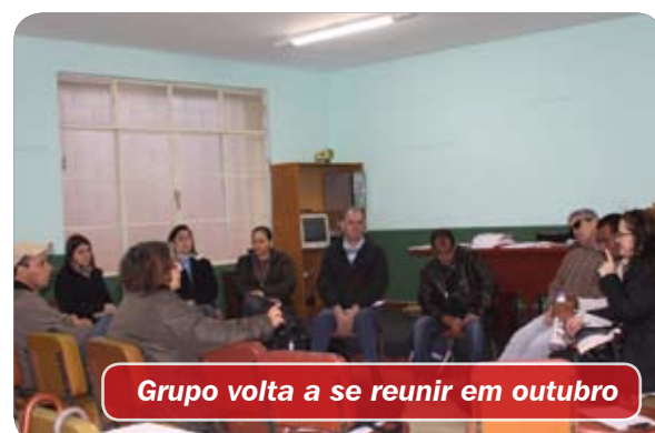
Grupo volta a se reunir em outubro