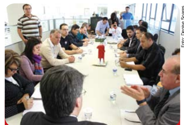
Em reunião com a Seap FES cobra agilidade do governo para resolver a questão