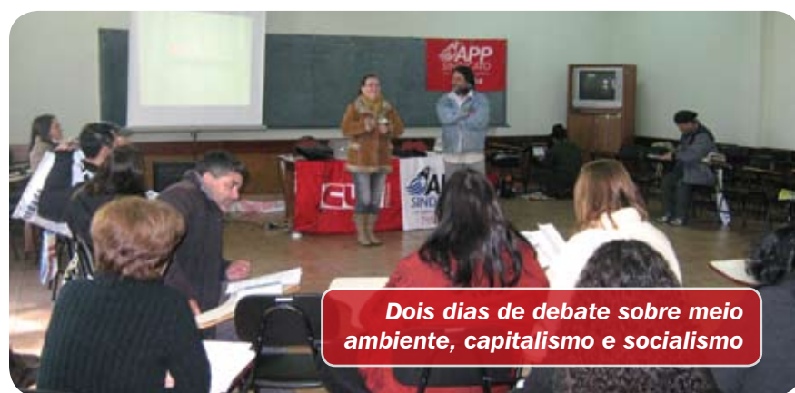
Dois dias de debate sobre meio ambiente, capitalismo e socialismo

Ao final do Seminário, foi criado o Coletivo de Meio Ambiente da APP.