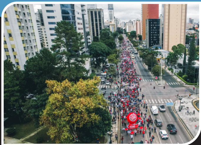
O 29 de abril marcou a retomada das ruas com ato massivo no Centro Cívico