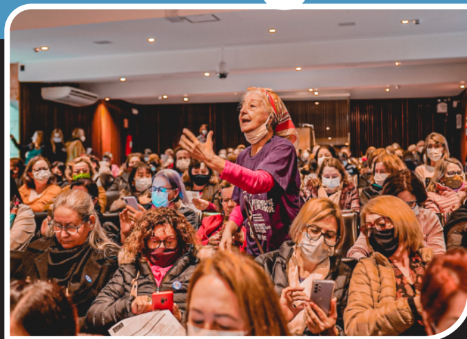
Marcha dos(as) aposentados(as) lotou a Assembleia Legislativa contra o confisco da Previdência

No 1º semestre, encerramos um ciclo de retomada das ruas e surpreendemos aqueles(as) que duvidavam da nossa força. A categoria foi corajosa e incansável. Em um período marcado por dificuldades das mobilizações populares em todo o país, a educação deu exemplo de unidade e força.