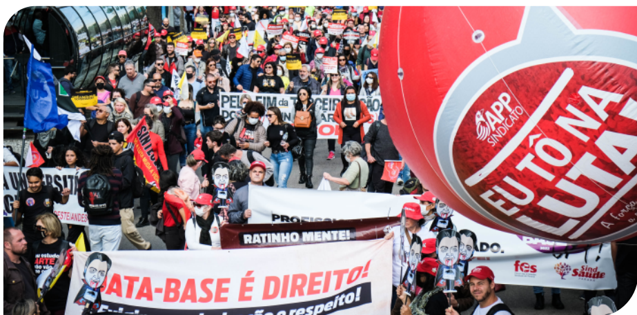
No 21 de junho, servidores(as) realizaram nova paralisação e ato histórico por Data-Base, contra a prova PSS e outras pautas

Daqui até outubro, sabemos o que fazer. Escolha a educação!